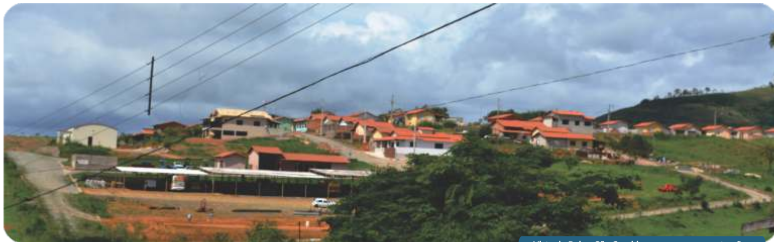
Vista do Bairro São Geraldo com as novas construções.

Em 2013, várias obras foram destaque para o crescimento do município, melhorando as condições de vida da população de Serra da Saudade.