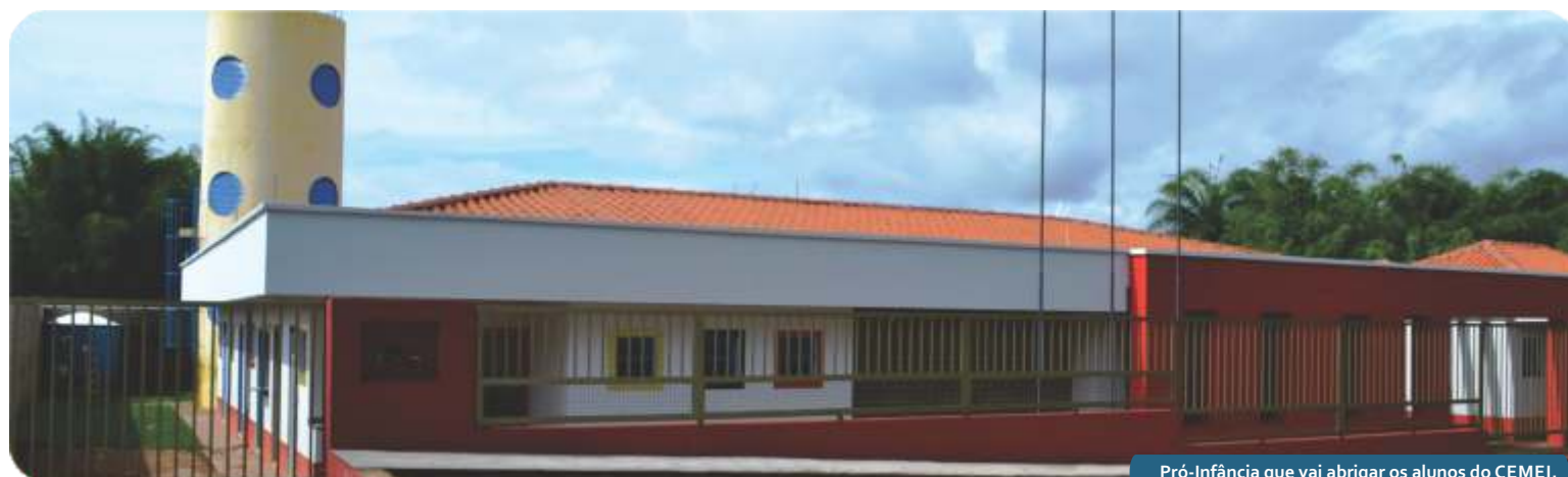
Pró-Infância que vai abrigar os alunos do CEMEI.