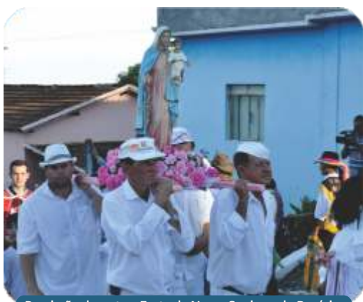
Procissão durante a Festa de Nossa Senhora do Rosário.