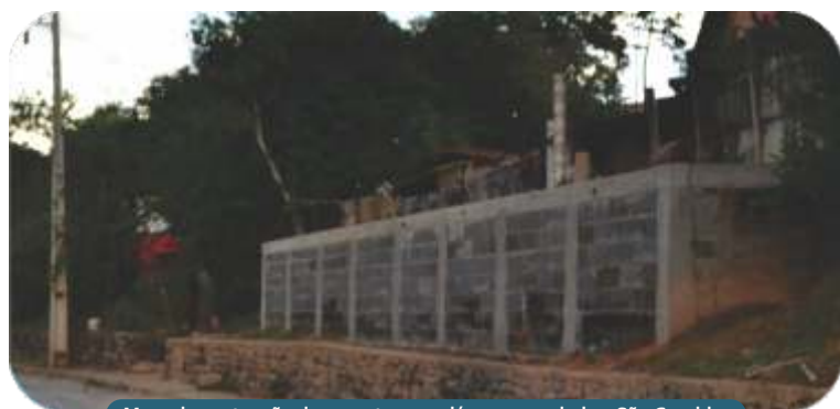
Muro de contenção de encostas que dá acesso ao bairro São Geraldo.

A administração Municipal pensando na segurança da população construiu em 2013, um muro de pedras nas encostas da rua Luiz Alfredo Ricardo, que dá acesso ao bairro São Geraldo para evitar a erosão e melhoria do trânsito no local.