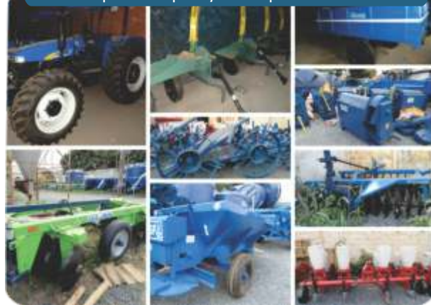
Máquinas entregues pelo deputado federal Ademir Camilo aos municípios contemplados, inclusive para Serra da Saudade.