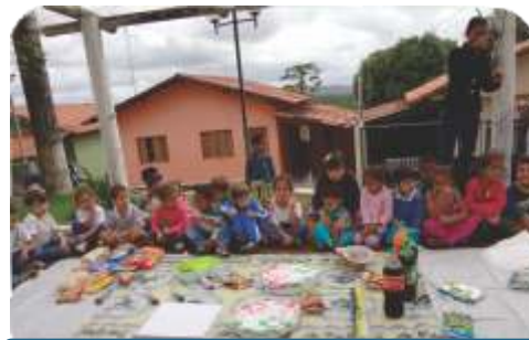
Atividades dos alunos do CEMEI durante a semana das crianças.