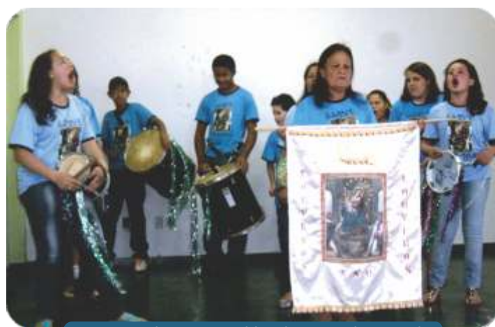
Apresentação de ternos (congadeiros) durante o projeto na escola.

Foram apresentados vários números plagiando a TV, em forma de telejornal, declamações de poesias, dança e música.