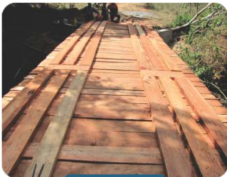
Construção da ponte da Barra Grande.