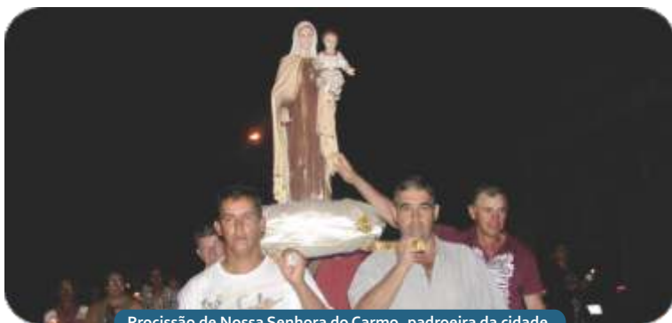
Procissão de Nossa Senhora do Carmo, padroeira da cidade.

Uma das ações foi o trabalho desenvolvido pelos alunos da Escola Municipal Luís Machado Filho do 4º, 5º, 6º e 7º anos do Ensino Fundamental, encerrado em outubro de 2013. Os alunos encenaram a retirada de Nossa Senhora da Gruta e contou com a participação dos ternos Moçambique, Pérolas da Serra e Serra Dourada e ainda, do Congo Penacho Mirim. Esse terno foi criado com o incentivo do projeto.