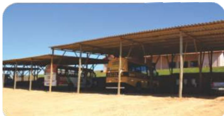
Garagem municipal recebe novo telhado para abrigar veículos e máquinas municipais.

O prédio que recebeu nova pintura e gramado conta com uma cozinha e local para guardar ferramentas e outros utensílios. A reforma da obra começou em maio e terminou em julho de 2013.