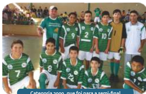
Categoria 2000, que foi para a semi-final