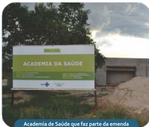
Academia de Saúde que faz parte da emenda parlamentar do deputado federal Ademir Camilo.