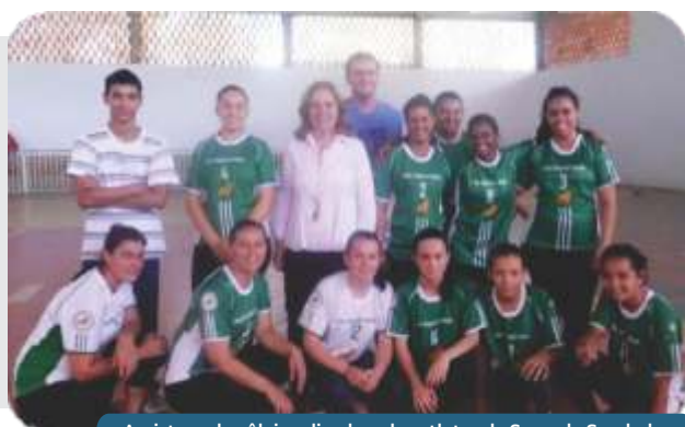
Amistoso de vôlei realizado pelas atletas de Serra da Saudade.