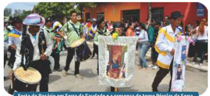
Festa do Rosário em Serra da Saudade e a presença do terno Pérolas da Serra.

Em Serra da Saudade a Festa de São Sebastião é realizada entre os meses de janeiro e abril, e em 2013, houve cavalgada, a participação dos carreiros com os carros de bois, para celebrar o dia do santo que é tão reverenciado pelos serranos.