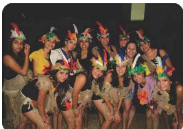
Grupo de dança de Serra da Saudade durante a apresentação no evento 50 anos de Medeiros.

Dia 06 de maio de 2013, no Salão Nobre da Escola Luís Machado Filho foi realizada a palestra sobre drogas com ênfase no Crack. O instrutor da PROERD, Cabo Ribeiro, falou sobre o tema: "CRACK e suas consequências na vida do usuário".