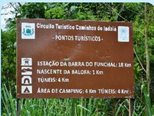
Placa localizada na entrada da cidade para orientar os turistas.

A intenção é facilitar a vida do turista para que consiga chegar aos atrativos do município com maior facilidade.