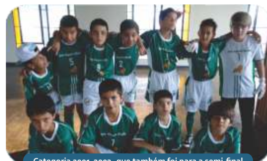
Categoria 2001-2002, que também foi para a semi-final