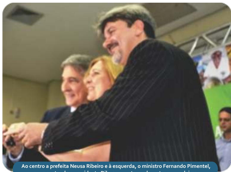
Ao centro a prefeita Neusa Ribeiro e à esquerda, o ministro Fernando Pimentel, representando a presidente Dilma, na entrega das retroescavadeiras.