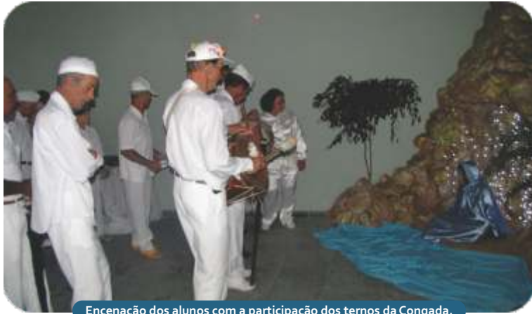
Encenação dos alunos com a participação dos ternos da Congada.

Em 2013, o Setor de Cultura de Serra da Saudade desenvolveu ao longo do ano, várias ações para o patrimônio cultural com o objetivo de registrar e salvaguardar os bens imateriais do município.