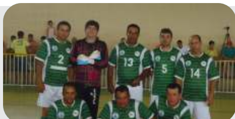
Equipe de Serra da Saudade, 3º colocado do torneio.