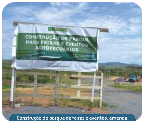
Construção do parque de feiras e eventos, emenda parlamentar do deputado federal Ademir Camilo.