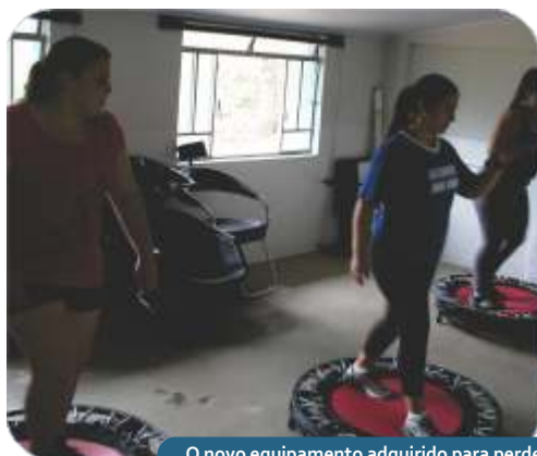
O novo equipamento adquirido para perder peso, Jump e a academia de Pilates.