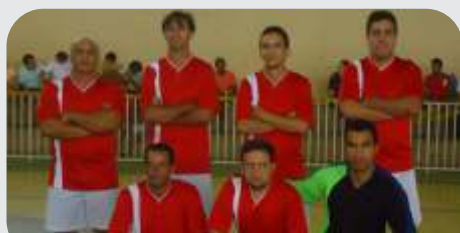
Equipe de Estrela do Indaiá, 1º lugar no torneio dos Veteranos.