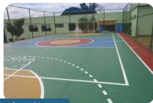
Acima, à esq., a Escola Luís Machado Filho que recebeu novo telhado, logo abaixo, interior da escola com pintura nova; ao centro, casas da Vila Vicentina e à direita, a nova quadra da escola Luís Machado Filho.