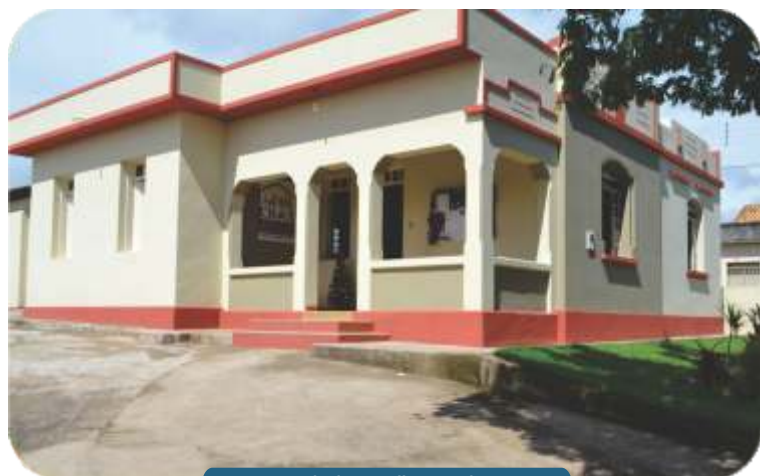
Nova Sede de atendimento do CRAS.