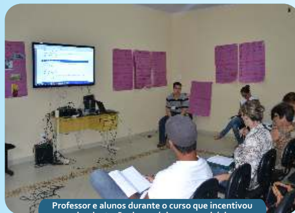
Professor e alunos durante o curso que incentivou a implantação de negócios no município.

Os primeiros 50 participantes receberam troféus e camisas, oferecidos pela Secretaria Municipal de Cultura e Esportes de Serra da Saudade.