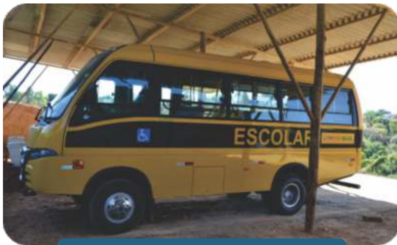
Ônibus adquirido para transporte dos alunos das escolas municipais.

O outro ônibus é traçado e mais apropriado para as estradas rurais, principalmente no período das chuvas, e possui espaço e cadeira de rodas.