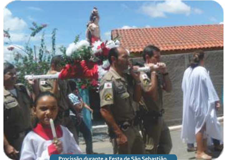
Procissão durante a Festa de São Sebastião.

Em 2013, entre os dias 6 e 16 de julho de 2013, houve missa, novena, carreata com a imagem de Nossa Senhora e procissão, reunindo a comunidade em um ato de fé.