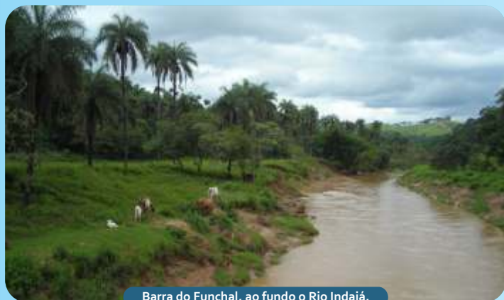
Barra do Funchal, ao fundo o Rio Indaiá.

Dia 17 de abril de 2013, o SENAR em parceria com a Prefeitura Municipal de Serra da Saudade entregaram os certificados para os participantes dos cursos de Turismo Agrícola, envolvendo áreas de Guia Turístico e Empreendedorismo Turístico. O evento foi realizado no Salão de Eventos do Centro Cultural Zé Mestre.