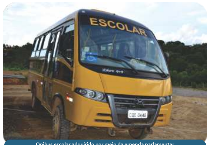
Ônibus escolar adquirido por meio da emenda parlamentar do deputado federal Ademir Camilo.